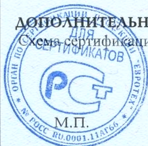
Схема сертификации: 2.